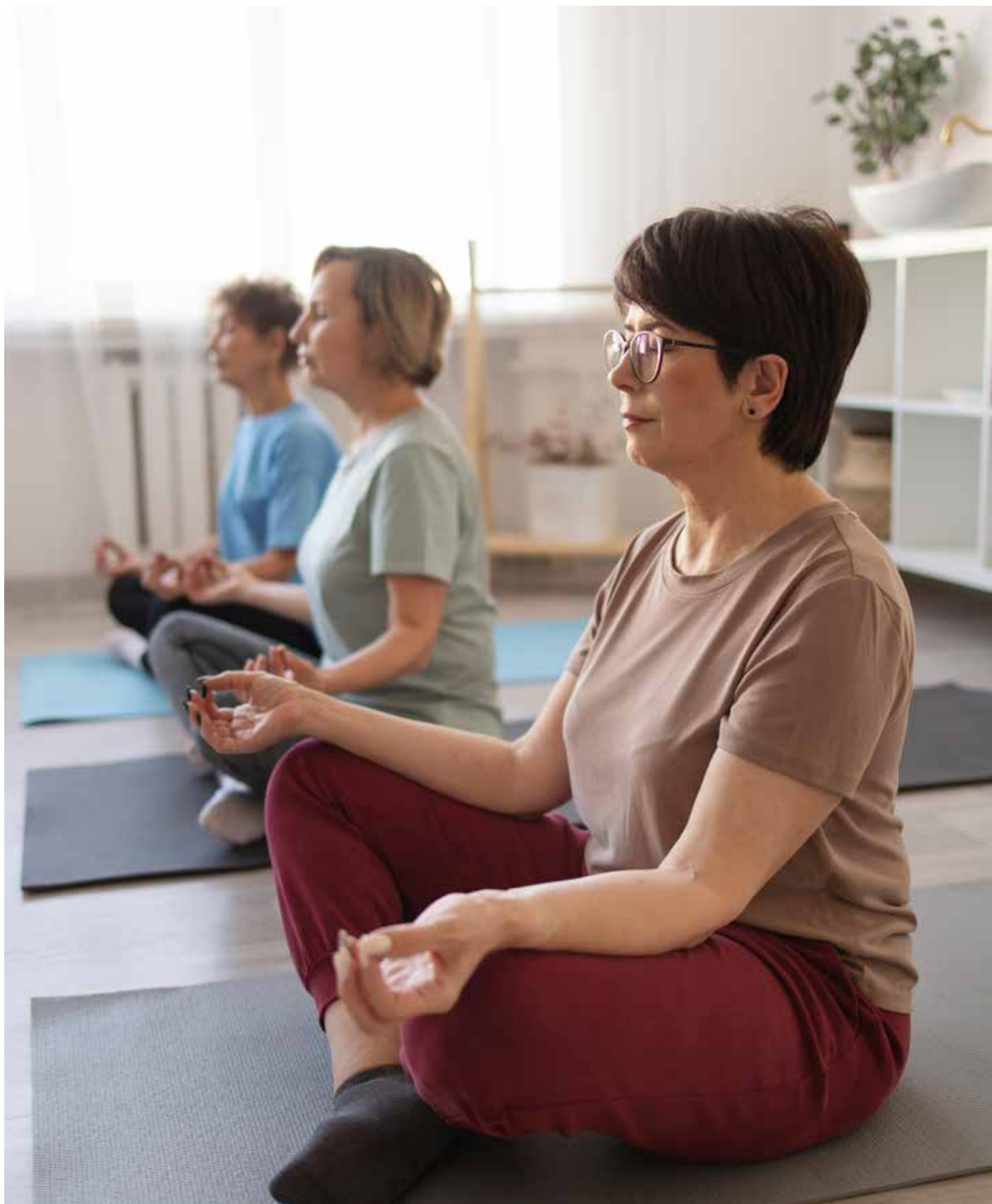
Na zdjęciu seniorki uprawiające jogę i spędzające czas razem.