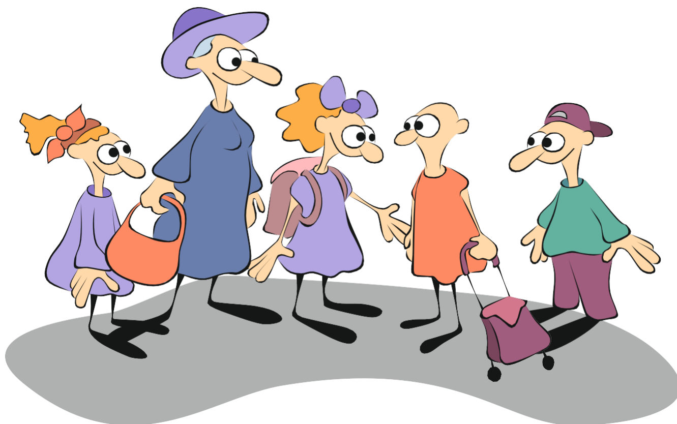
Rysunek: Dzieci witają dziewczynkę z chorobą nowotworową.

Istnieje wiele ciekawych świadectw takich działań, może nienagłośnionych, może podejmowanych w bardzo małym zakresie – np. w formie pomocy sąsiedzkiej poprzez popilnowanie dziecka, ugotowanie obiadu czy po prostu rozmowa, wysłuchanie, a czasami gest. Być może zdania skierowane do dziecka z chorobą przewlekłą, takie jak „Wierzę w ciebie”, „W czym ci pomóc?” lub okazanie zwykłej radości z najmniejszego, ale okupionego dużym wysiłkiem sukcesu szkolnego, są tak samo potrzebne jak opracowanie materiałów opartych na wynikach badań naukowych.