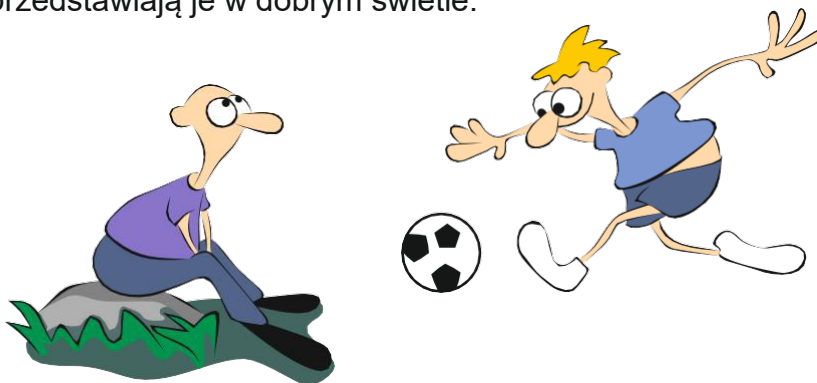
Rysunek: Chłopiec zachęcający drugiego do gry w piłkę.

Dobłą praktyką oswojania strachu i rozmawiania o nim są ROZMOWY O STRACHACH