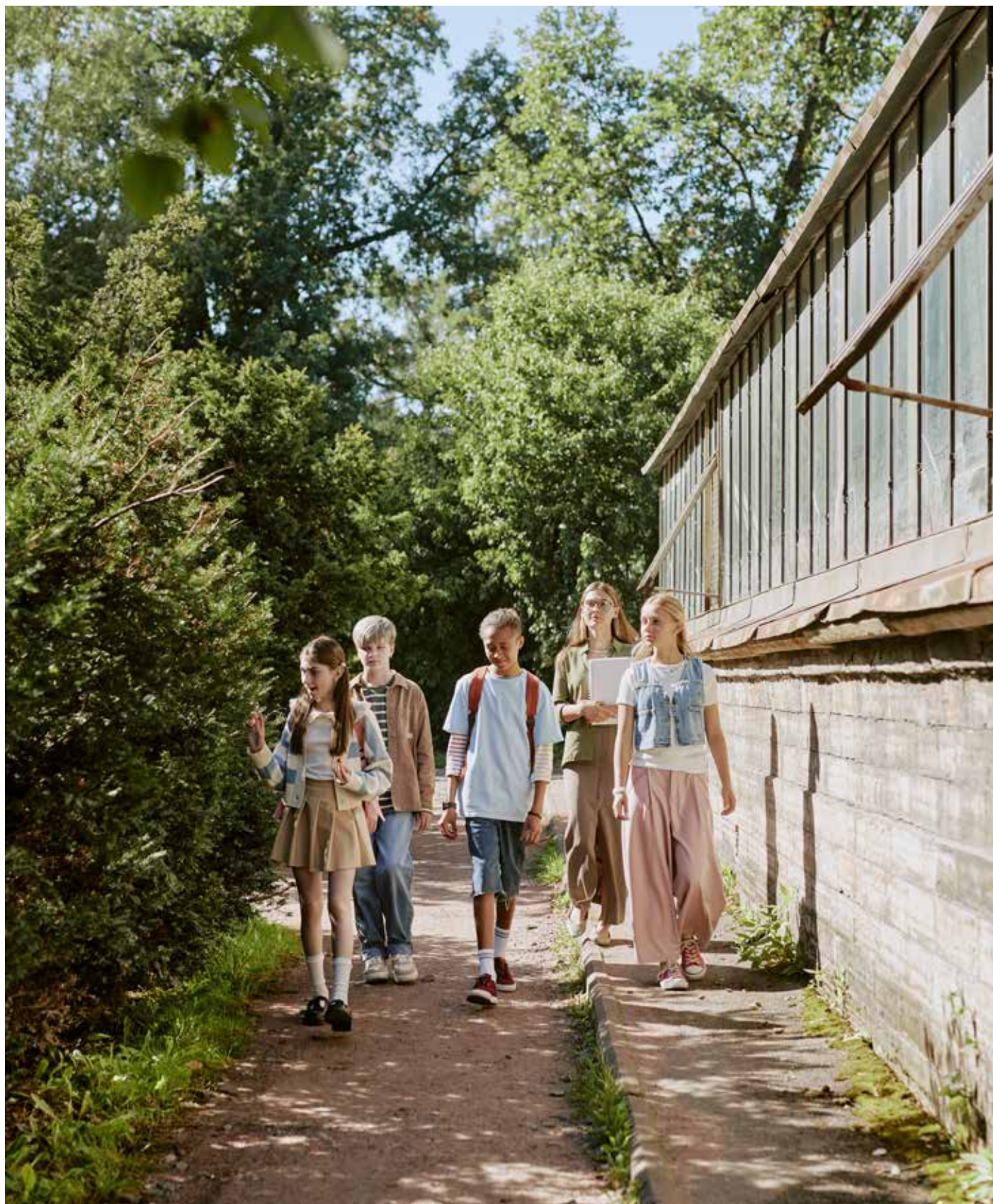
Nauczycielka i nastolatki spacerują po ogrodzie botanicznym